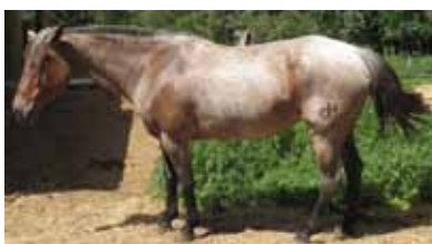
Escore Corporal 4 a 6

Coluna nivelada. Costelas não estão visíveis, mas podem ser facilmente sentidas. Ombros e pescoço conectam-se perfeitamente no corpo.