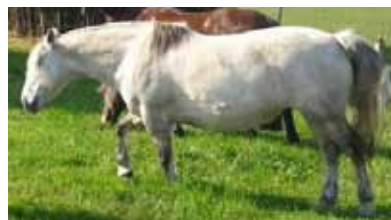
Escore Corporal 7 a 9

Dobras de gordura nas costas. Dificuldade de sentir costelas. Gordura na base da cauda. Espessamento do pescoço e parte interna das coxas.