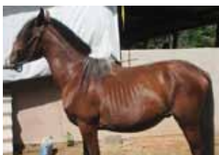
Escore Corporal 1 a 3

Nenhum tecido de gordura. Espinha, base da cauda e costelas proeminentes. Estrutura óssea facilmente visível.